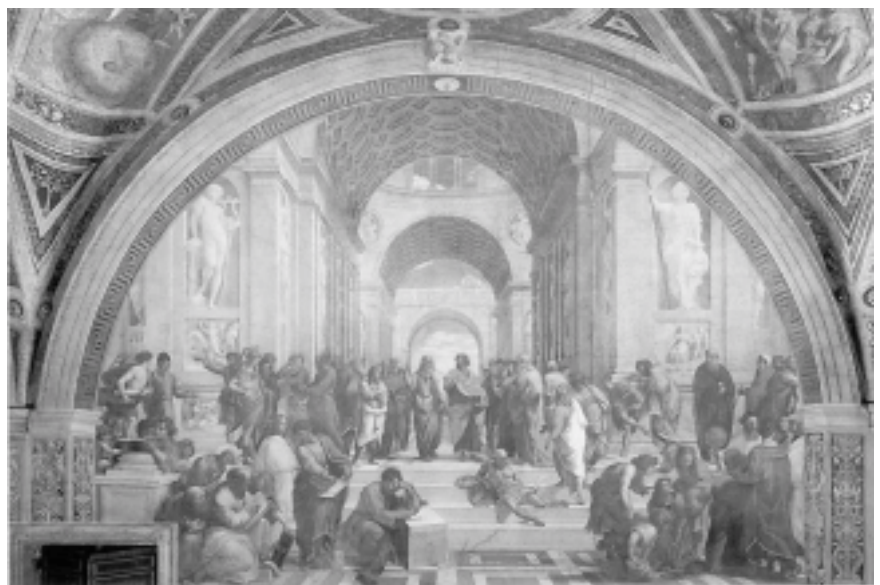
Raffaels "Philosophenschule von Athen" (ca. 1510) in der Stanza della Segnatura des Vatikan

nen Freunden nicht zu schaden, das erscheint sofort einleuchtend und wird mittlerweile auch von der Evolutionsbiologie gestützt. Auch die Nachbarin lebt noch relativ nahe und ich bin darauf angewiesen, dass sie mich gleichermassen behandelt, wenn ich in Sicherheit leben will.