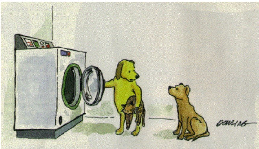
"Unsinn. Nach ethischen Richtlinien durchgeführt sind Tierversuche ein unschätzbare Mittel der Wissenschaft."

Restaurant "Schweighof" Schweighofstr. 232