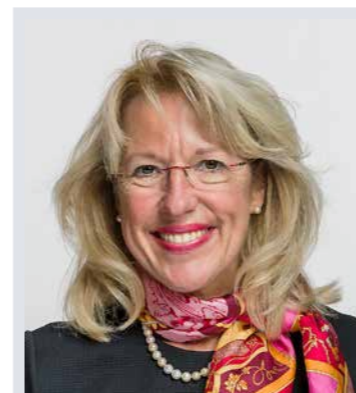
JACQUELINE DE QUATTRO Anwältin Nationalrätin FDP

Der Terrorismus erschüttert unsere Gesellschaft und bedroht Freiheit, Grundrechte und Sicherheit. Die Schweiz ist keine Insel der Sicherheit und hat die hoheitliche Aufgabe, Gefahren für die innere Sicherheit vorzubeugen. Die Schweiz hat eine vorausschauende Drei-Säulen-Strategie entwickelt: den 2017 von Bund und Kantonen verabschiedeten Nationalen Aktions-