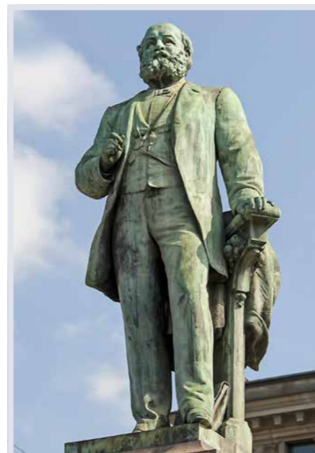
Escher-Denkmal in Zürich