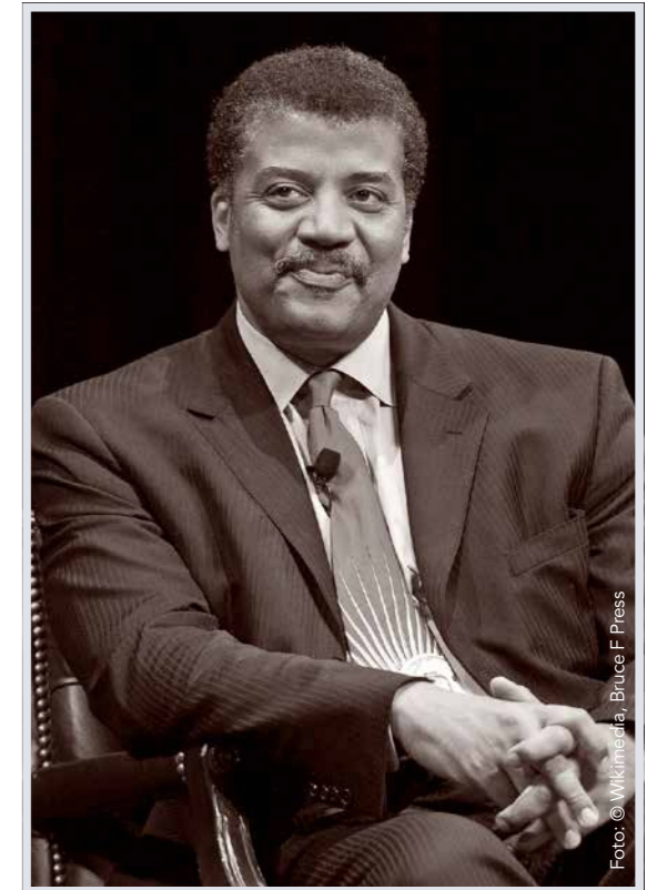
SCHLUSS | PUNKT

Und seine ironischen Beispiele wider den Glauben an einen intelligenten Designer der Schöpfung lassen durchaus den Schluss zu, dass er Menschen, die an einen solchen Unsinn glauben, für Idioten hält. «Warum nicht all die Dinge zusammenzählen, deren Design so klobig, doof, unpraktisch oder nicht praktikabel ist, dass sie das Fehlen von Intelligenz widerspiegeln? Wir essen, trinken und atmen durch dasselbe Loch im Kopf, und so ist Ersticken die vierthäufigste Ursache für den unbeabsichtigten Tod durch Verletzungen in den Vereinigten Staaten. Oder nehmen wir