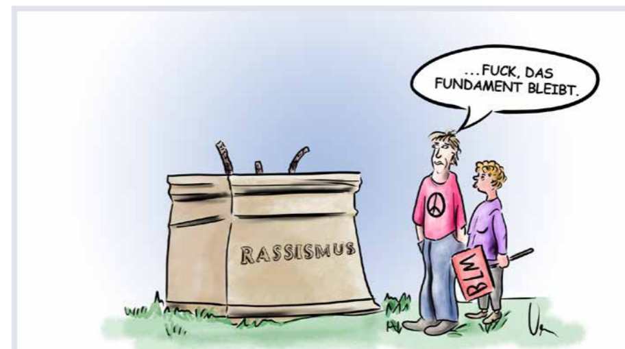
Karikatur: © Vera Bueller