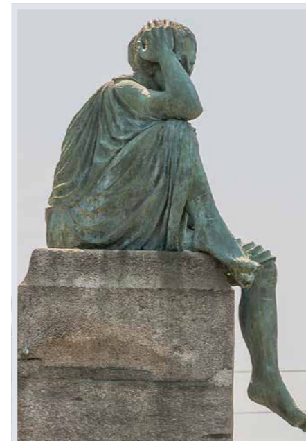
Helvetia-Denkmal in Basel