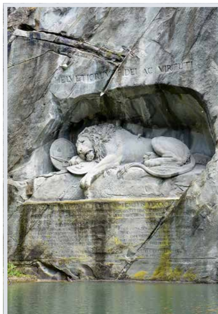
Löwen-Denkmal in Luzern