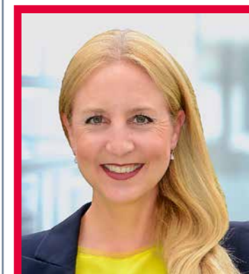
LIC. IUR. KATJA CHRIST Anwältin Nationalrätin glp

Terrorismus ist eine ernste Bedrohung. Es ist daher richtig, die gesetzlichen Instrumentarien gegen Terrorismus regelmässig zu überprüfen und auf veränderte Bedrohungslagen zu reagieren. Dabei sind die rechtsstaatlichen Grundsätze aber strikt zu wahren und Einschränkungen der Grundrechte sind abzulehnen.