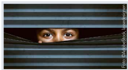
Wie diskriminierend ist die Schweiz? Von Sandro Bucher Seite 8

«Metamorphose» – eine Theater-Tanz-Performance 28