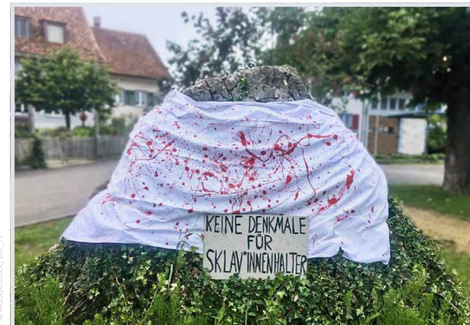
Sutter-Denkmal in Rünenberg, von der JUSO Baselland im Juni 2020 verhüllt...