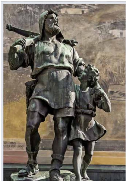
Tell-Denkmal in Altdorf